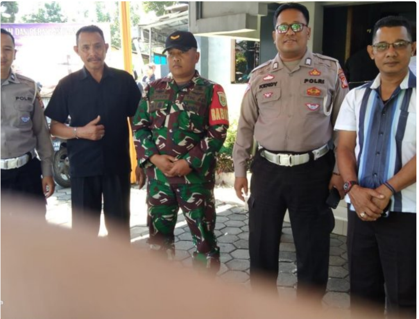
TNI dan Polri Lakukan Pengamanan Ibadah Jumat Agung, jumat 29 maret 2024

DAYEUKOLOL - Personel Polsek Dayeuhkolot bersama personil TNI dari koramil 2407 melakukan pengamanan DI gereja GPIB PNIEL YUDHA WYOGRHA di wilayah Kecamatan Dayeuhkolot, dalam rangka ibadah Jumat Agung, Jumat (29/3/2024)